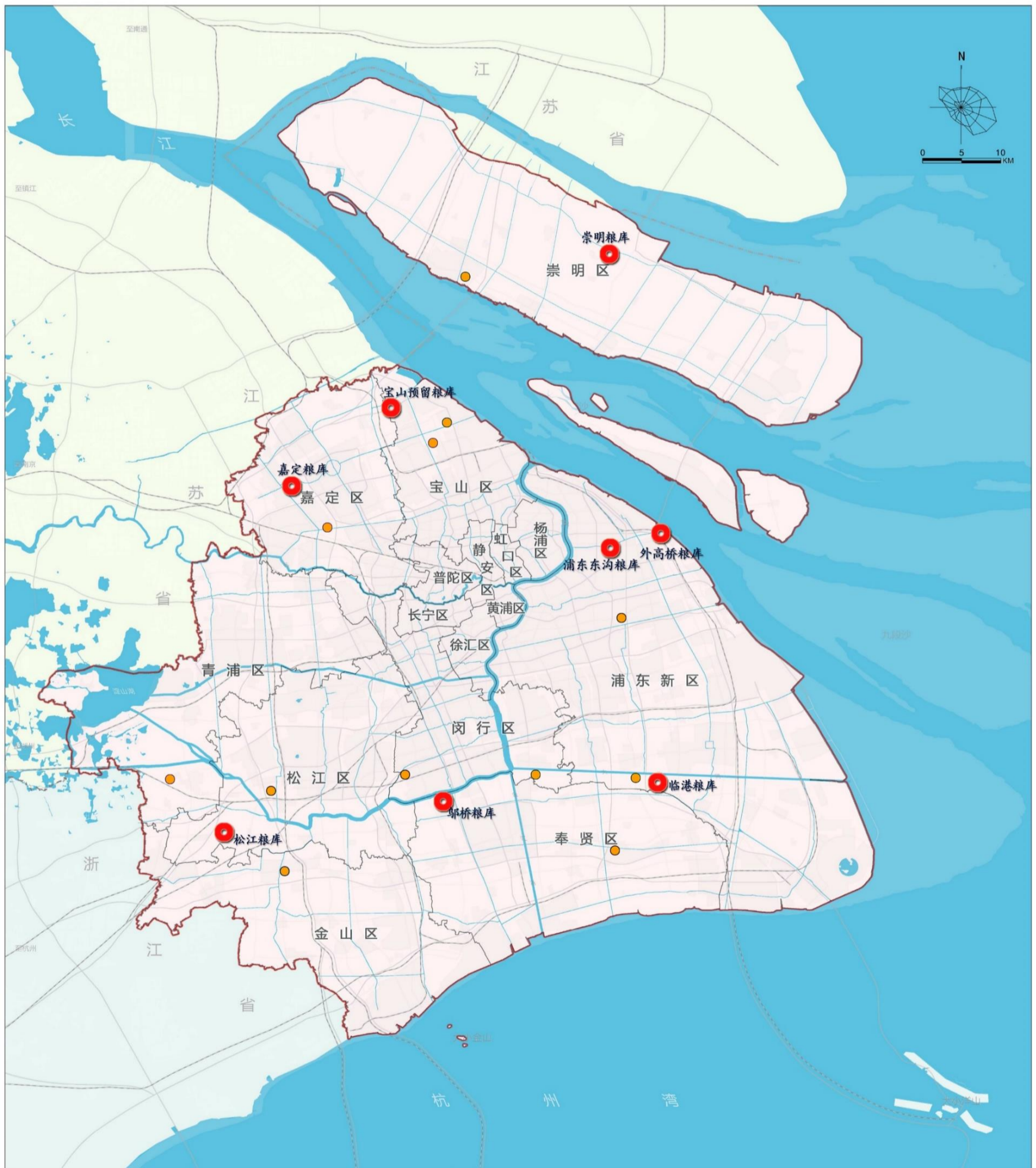
市、区级储备粮库规划布局图

充分依托和利用现有库点，按照“东西南北中”均衡布局、互为支撑、避免集中的原则，进一步优化市区两级储备粮库空间布局。